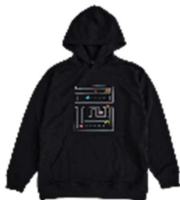
TGS PAC-MAN ステージパーカー ¥8,990 (税込) BLACK/フリーサイズ