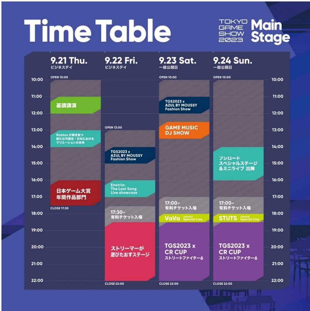
TGS2023メインステージフロアマップ