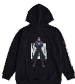
TGS TEKKEN 8 KAZUYA グラフィックパーカー ¥8,990 (税込) BLACK/フリーサイズ