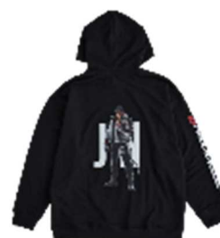
TGS TEKKEN 8 JIN グラフィックパーカー ¥8,990 (税込) BLACK/フリーサイズ