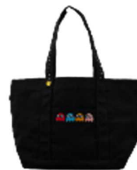
TGS PAC-MAN トートバッグ ¥5,490 (税込) BLACK/フリーサイズ