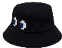
TGS PAC-MAN バケットハット ¥4,490 (税込) BLACK/フリーサイズ