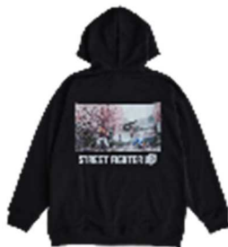
TGS SF6 バックグラフィックパーカー ¥8,990 (税込) BLACK/フリーサイズ